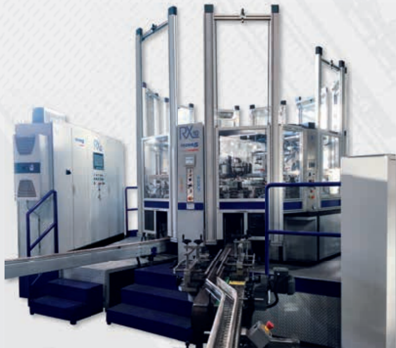
RX 系列 全电子化 - 紫外线 RX8 | RX10 | RX10S | RX12 | RX17